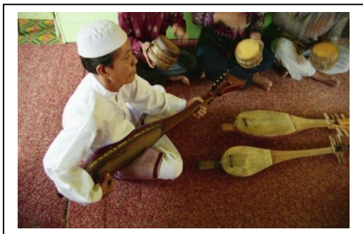
Gambar 8 H Zakaria M A(Tikar Media.ot.id)

Dari berbagai lagu-lagu daerah di Nusantara memiliki fungsi sebagai pelestari budayanya, karena tema-tema dan cerita di dalam syair menggambarkan budaya secara jelas, syair-syair lagu sering juga berasal dari pantun-pantun yang biasa dilantunkan oleh masyarakat. Secara tak langsung budaya dapat dipertahankan oleh masyarakatnya.