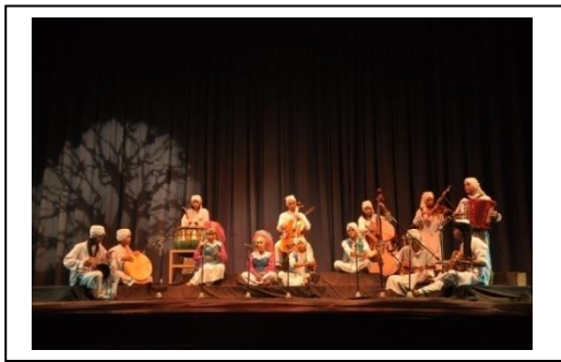
Gambar 5. Pertunjukan Pentas di ISI Padang panjang.

Contoh: dalam acara pertunjukan dari berbagai daerah