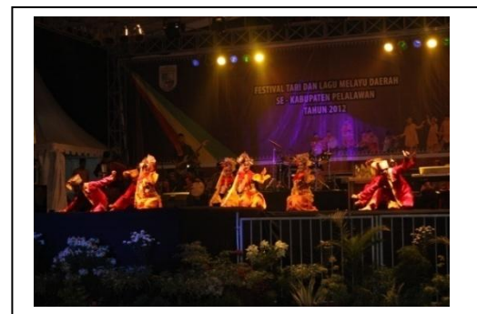
Gambar 4. Pertunjukan Pentas di palalawan

Hiburan (entertain) adalah suatu kegiatan untuk menyenangkan hati seseorang atau publik. Ansambel musik Gambus Riau memiliki banyak fungsi dalam masyarakat, misalnya dalam penyambutan tamu, dalam acara hajatan. Perkembangan Ansambel musik Gambus Riau saat ini mengalami perubahan yang pesat, bila dilihat dari sajian musik dengan penambahan-penambahan instrument barat, seperti gitar, bass, drum dan keyboard. Menjadikan Ansambel musik Gambus Riau lebih memiliki nilai-nilai hiburan yang baik. Sajian lagu yang dihadirkan dengan genre (aliran) pop melayu.