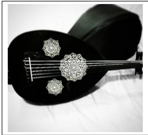
Gambar 2. Oud Arab

dan Kesenian Tradisional Daerah Riau, Pekanbaru, Bidang Kesenian, 1884).