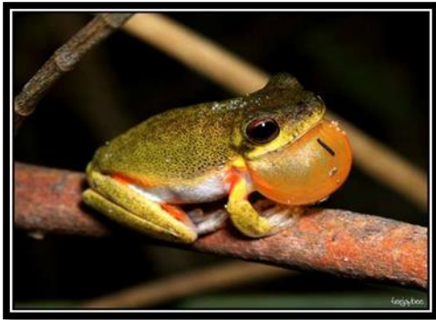
Gambar 1. Katak mozart,

Sumber: http://asपाल-putih.blogspot.com/2011/03/nyanyian-katak-macaya-dan-katak.html#ixzz1eGtwKyko/20-10-2011/20;34 .