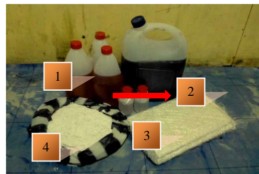
Gambar 3. Bahan fiberglass, 1) Resin, 2) Catalis 3) Serbuk kaca (meed), 4) Tepung tulang.

Media merupakan suatu unsur yang sangat vital, di samping itu pemilihan media yang tepat sangat mempengaruhi nilai sebuah karya seni. Menurut Mikke Susanto media berarti perantara atau penengah, biasanya dipakai untuk menyebut berbagai hal yang berhubungan dengan bahan (Mikke Susanto, 2011: 255). Maksud perantara di sini adalah seorang seniman menggunakan media sebagai sarana untuk mengekspresikan ide dan gagasannya. Bagaimana mungkin seorang seniman mampu mengeskpresikan ide dan gagasannya tanpa perantara dari sebuah media, maka dari itu media merupakan sarana yang sangat penting dalam melahirkan sebuah karya seni.