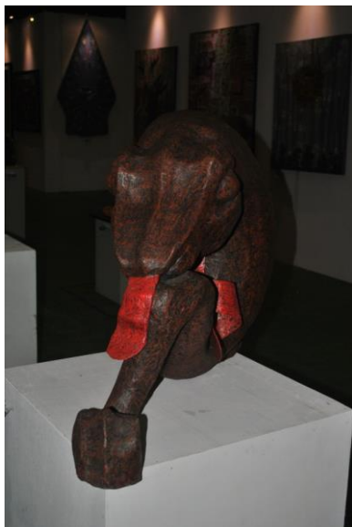
Gambar 9. “Dibalik Nyanyianmu”, 70 x 20 x 20 cm, Fiber, Mukhsin 2011.