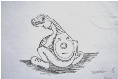
Gambar 4. Sketsa alternatif 1, Mukhsin Patriansyah 2012

Melalui pengamatan baik secara langsung maupun tidak langsung terhadap sumber ide yang akan diciptakan, selanjut dilakukan proses pembuatan sketsa alternatif sebagai awal pembuatan sketsa terpilih yang terdiri dari teknik, bentuk dan finishing. Kemudian dipilih beberapa sketsa untuk dilanjutkan dalam perwujudan nantinya.