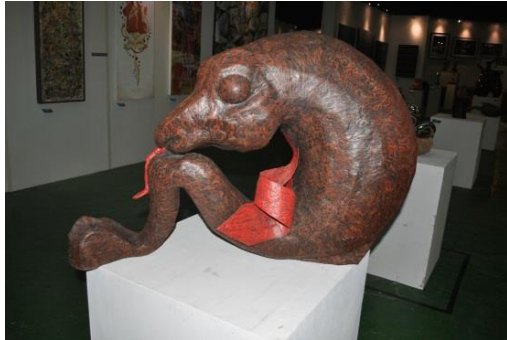
Gambar 8. “Dibalik Nyanyianmu”, 70 x 20 x 20 cm, Fiber, Mukhsin 2011.

dilakukan untuk mengetahui seberapa keberhasilan dari karya yang telah kita wujudkan.