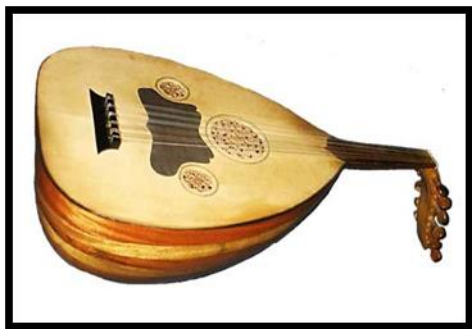
Gambar 2. Alat musik gambus Melayu,