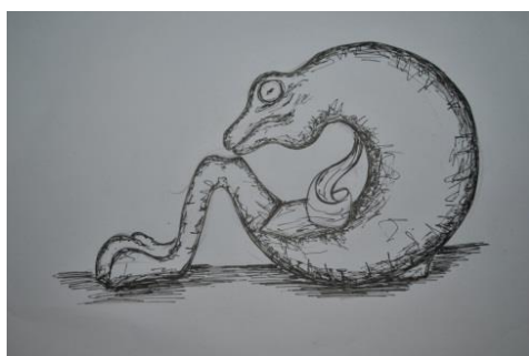
Gambar 6. Sketsa alternatif 3 Mukhsin Patriansyah 2012