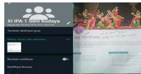
Gambar 2. Grup kelas XI IPA 1 dan buku materi pelajaran seni budaya