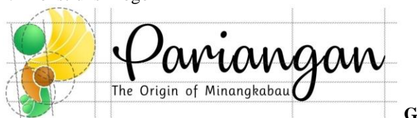
Gambar 6. Konstruksi Logo

Konstruksi logo bertujuan untuk menjaga agar tetap pada proporsi yang benar sesuai ketentuan. Ketentuan ini juga berfungsi untuk tetap menjaga ciri khas logo baik itu ukuran dan jarak antara elemen-elemen yang terdapat