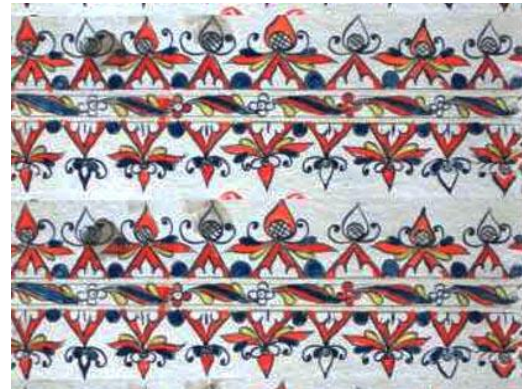
Gambar 1. Iluminasi Kambang Reno

Unsur-unsur visual dalam perancangan brand identity nagari Pariangan terinspirasi dari keindahan motif iluminasi naskah tua yang berasal dari nagari Pariangan. Dari beberapa jenis motif iluminasi naskah tua yang ada di nagari Pariangan, dipilihlah motif Kambang Reno yang terdapat dalam motif iluminasi naskah kuno.