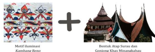
Gambar 2. Sumber Inspirasi Bentuk Visual

Reno yang berarti emas, adalah merupakan warisan budaya dan seluruh potensi di nagari Pariangan yang berharga bagaikan emas. Emas adalah perwakilan dari sesuatu yang sangat berharga baik dulu dan sekarang. Berkilau dan menarik perhatian banyak orang, Reno juga bisa di artikan dengan perhiasan, karena nenek moyang orang Minangkabau sejak dahulu memiliki keterampilan membuat perhiasan baik dari emas ataupun perak.