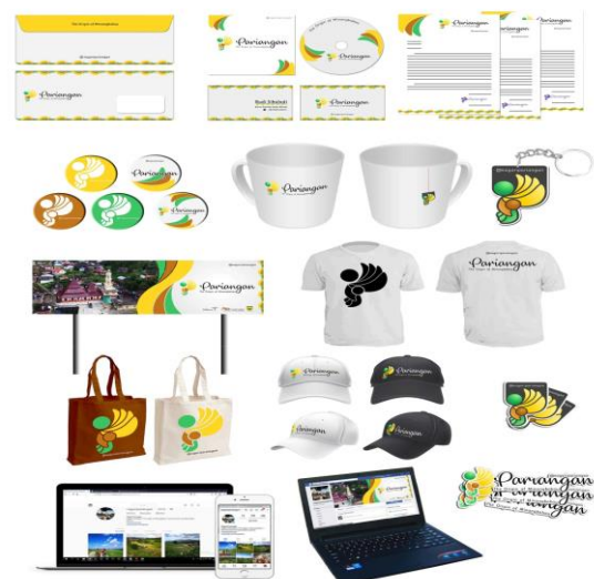
Gambar 7. Media Pendukung

Media digital yang dipakai dalam perancangan brand identity nagari Pariangan ini berupa Instagra dan facebook . Dari beberapa media pendukung yang dirancang tentunya melalui proses perancangan alternatif desain, memilih final desain dan aplikasi medianya