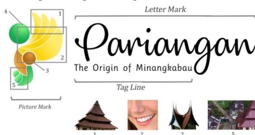
Gambar 5. Pembagian Komponen Logo

Logo Nagari Pariangan terdiri dari picture mark dan letter mark . Dalam picture mark terbagi lagi kedalam beberapa komponen logo yang tidak boleh di pisah dan di ubah. Sedangkan pada letter mark terdapat tag line yang menjadi khas tersendiri bagi logo ini. Dalam pengampikasian logo nagari Pariangan ini bagian picture mark dan letter mark boleh dipisah. Ketentuan ini agar logo lebih fleksibel ketika di aplikasikan pada media yang berukuran kecil.