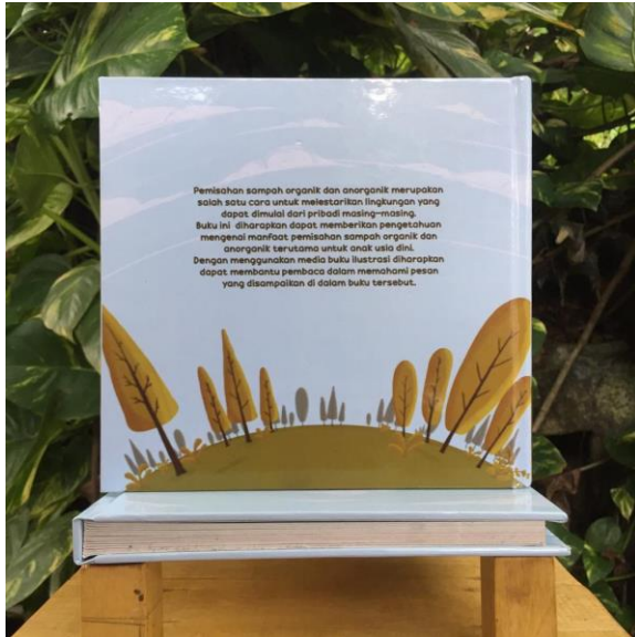
Gambar 13. Sampul belakang buku.

CartoCSS. (2019). CartoCSS Color Mixing Functions . https://carto.com/help/tutorials/cartocss-color-mixing-functions/