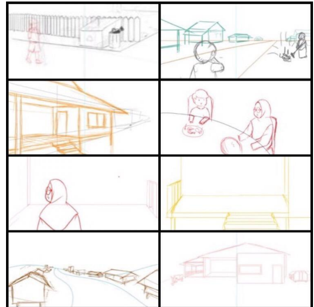
Gambar 1. Sketsa

Pada tahap produksi penulis membuat sketsa berdasarkan storyboard yang telah dibuat sebelumnya. Dalam pembuatan sketsa yang dilakukan dengan cara digital menggunakan perangkat lunak Adobe Photoshop CC 2019.