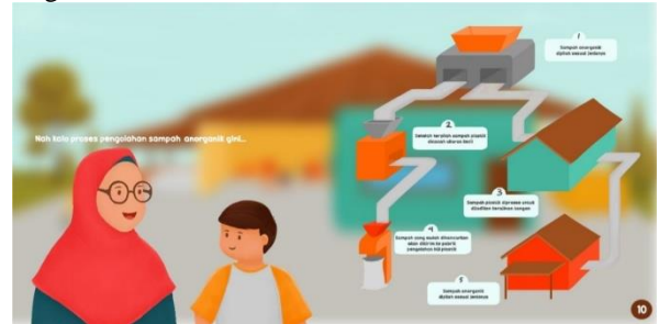
Gambar 10. Penjelasan pengolahan sampah

Penjelasan tentang proses pengolahan sampah pada ilustrasi ini menggunakan bentuk infografis untuk memudahkan pembaca dalam memahami isi materi yang disampaikan. Objek TPS sebagai latar belakang diblur untuk membuat pembaca dapat lebih fokus membaca infografis