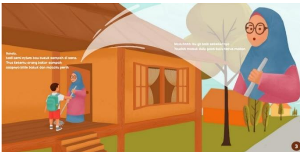
Gambar 8. Ulul Azmi mengadu pada ibunya.

Lalu penggambaran Ulul Azmi sedang mengadu pada ibunya tentang aroma sampah yang mengganggu dirinya dengan menunjuk ke arah jalan yang sebelumnya dilaluinya. Dalam ilustrasi ini penulis menggunakan jenis layout rata kiri, lalu penulis meletakkan close up karakter ibu di pojok kanan atas untuk mengisi ruang kosong di area tersebut dan juga sebagai tempat untuk menulis dialog. Warna objek utama dibuat berlawanan dengan latar belakang yang memungkinkan karakter tetap menjadi titik pusat perhatian walaupun dengan ukuran yang tidak terlalu besar.