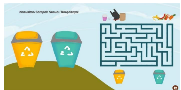
Gambar 12. Sisipan permainan interaktif.

Pada akhir isi buku, terdapat tambahan yaitu permainan interaktif yang diharapkan dapat menghilangkan rasa bosan saat membaca buku, dan juga dapat membuat anak-anak dapat berinteraksi langsung dengan materi yang disampaikan dalam buku. Permainannya adalah memasukkan sampah sesuai tempatnya dan labirin sampah.