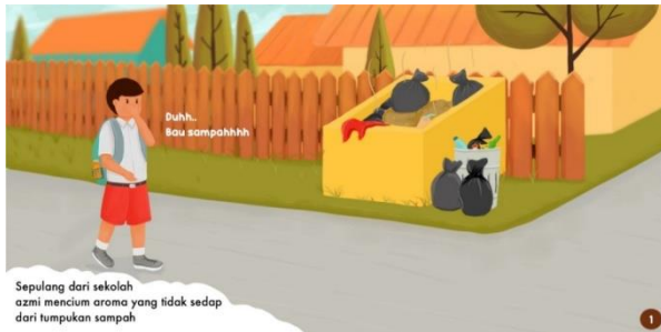
Gambar 7. Ulul Azmi mencium aroma sampah.

Lalu penggambaran Ulul Azmi sedang mengadu pada ibunya tentang aroma sampah yang mengganggu dirinya dengan menunjuk ke arah jalan yang sebelumnya dilaluinya. Dalam ilustrasi ini penulis menggunakan jenis layout rata kiri, lalu penulis meletakkan close up karakter ibu di pojok kanan atas untuk mengisi ruang kosong di area tersebut dan juga sebagai tempat untuk menulis dialog. Warna objek utama dibuat berlawanan dengan latar belakang yang memungkinkan karakter tetap menjadi titik pusat perhatian walaupun dengan ukuran yang tidak terlalu besar.