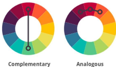
Gambar 4. Visualisasi aturan warna komplementer dan analogus.

Ketiga, warna yang akan digunakan dalam buku ini menggunakan kombinasi warna analogus dan komplementer. Warna analogus itu sendiri adalah warna-warna yang berdekatan dalam roda warna, sedangkan warna komplementer adalah warna yang letaknya berlawanan dalam roda warna.