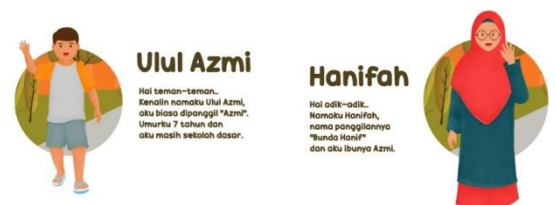
Gambar 6. Pengenalan tokoh dalam buku.

Bagian isi buku ini diawali dengan pengenalan tokoh yang ada terlebih dahulu. Ulul Azmi sebagai anak dan Hanifah adalah ibu.