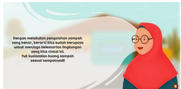
Gambar 11. Pesan dan nasehat (kesimpulan).

Pada akhir cerita, karakter hanifah (Ibu) memberikan pesan dan nasehat untuk pembaca tentang pengolahan sampah yang benar. Pada halaman ini penulis menggunakan warna hitam pada tulisan supaya kontras dan dapat memudahkan dalam membaca.