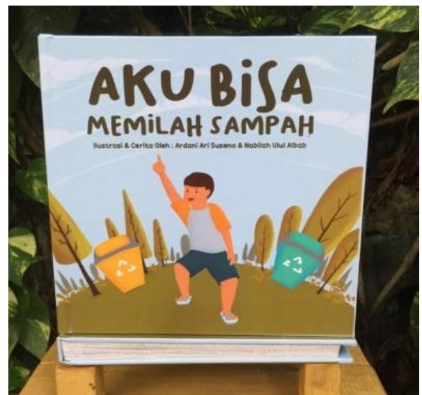
Gambar 5. Sampul depan buku.

Sebagai identitas buku, penulis memilih huruf bakso sapi pada judul yang memiliki penekanan dibanding objek lain dengan cara meletakkannya di posisi atas dengan ukuran yang cukup besar. Kemudian dari segi warna huruf, penulis menggunakan warna yang sama dengan batang pohon untuk memberikan kesatuan pada desain sampul depan tersebut. Selanjutnya sampul depan ini dicetak dengan ukuran 20x20 cm dan menggunakan bahan hard cover greyboard ukuran 3mm.