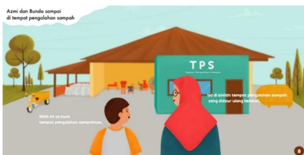
Gambar 9. Hanifah (Ibu) mengajak Ulul Azmi ke TPS.

Hanifah (Ibu) mengajak Ulul Azmi ke Tempat Pembuangan Sampah untuk memberi pengetahuan tentang sampah secara langsung. Layout yang digunakan dalam ilustrasi ini adalah rata tengah untuk memberikan keseimbangan dalam ilustrasi ini. Penulis juga meletakkan objek yang kontras dengan latar belakang seperti kedua karakter, bangunan dan peralatan pengolah sampah di tengah-tengah untuk memberikan kesatuan pada objek penting.