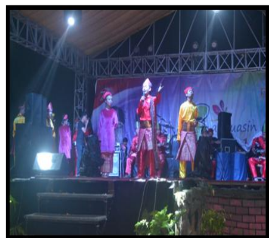
Gambar 3. Tahap komplikasi, mulai timbul kerumitan.

Dengan kedatangan Pengharapan yang berwajah kasar, mereka berlarian dan berteriak ketakutan sambil meminta tolong. Lalu para pengawal segera datang dan menolong tuhan Putri, Dayang dan Mak Dayang. Terjadi perkelahian, tetapi Pengharapan sadar akan jumlah yang dihadapi, dan ia pun melarikan diri. Lalu melaporkan kepada Raja Manggala bahwa ia bertemu dengan wanita cantik yaitu Zahara Siti.