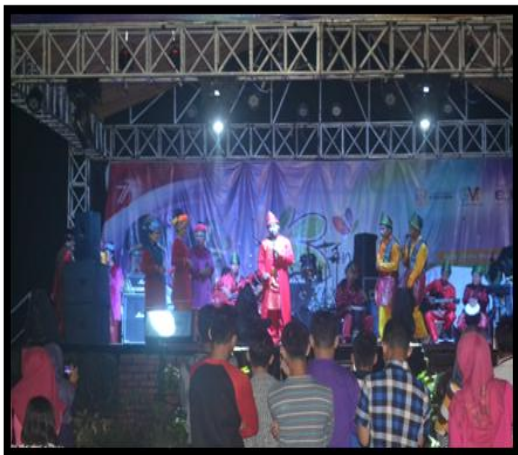
Gambar 5. Tahap resolusi, mulai penguraian atau penurunan emosi lakon.

Zahara Siti : Daulat ayahanda yang bijak bestari . Dengan sebenar ananda berperi, ananda mohon kepada ayahanda empunya diri , bilamana ada orang di dalam negeri baikpun orang asing negeri hendak meminang ananda empunya diri , janganlah diterima sama sekali dikarenakan ananda belum berniat untuk bersuami. Karena ananda masih banyak menuntut ilmu untuk bekal ananda di kemudian hari. Begitu saja ananda berperi kepada ayahanda di dalam negeri.