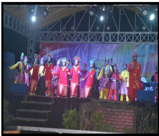
Gambar 2. Tahap pengenalan (eksposisi).

Pengenalan, terhadap tokoh Dayang I, II, dan Mak Dayang ini merupakan bagian dari tahap awal (eksposisi) dari pertunjukannya dan pengenalan tokoh Zahara Siti sebagai tokoh utama (tokoh sentral). Diceritakan bagaimana penggambaran watak dari tokoh utama yaitu Zahara Siti, Dayang serta Mak Dayang yang lebih banyak menonjol dalam adegan seperti yang telah tergambar pada dialognya.