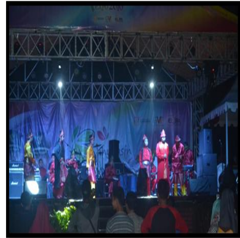
Gambar 4. Tahap klimaks, telah mencapai titik kulminasinya.

Tak lama kemudian, sebelum Zahara Siti masuk ke dalam istana, datanglah utusan dari Raja Manggala yang bernama Mangkubumi. Dengan tingkah yang tidak sopan, membuat panglima kerajaan Yaman Negeri marah kepada Mangkubumi. Bermaksud untuk melamar Zahara Siti, tetapi lamarannya ditolak. Mangkubumi pun pergi melaporkan lamarannya, hingga membuat Raja Manggala murka kepada Raja Yaman dan ingin menyerang kerajaan Yaman Negeri.