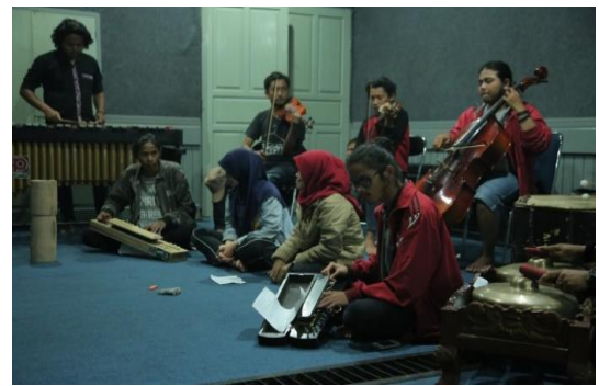
Gambar 2. Proses Latihan.

Gambar 1. Gambar di atas merupakan salah satu foto pertunjukan komposisi musik karawitan yang terinspirasi dari keunikan saluang sirompak . Komposisi ini terdiri dari tiga bagian, Foto ini merupakan salah satu foto pertunjukan karya bagian ketiga. Pengkarya menggabungkan dua bentuk seni menjadi satu, yaitu seni musik dan seni rupa dengan konsep performing art.