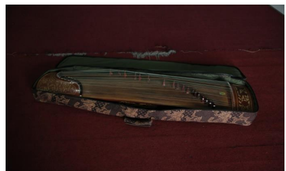
Gambar 4. Instrumen Kecapi Sunda.

Gambar ini merupakan salah satu dokumentasi proses latihan karya komposisi musik karawitan yang terinspirasi dari saluang sirompak . Pengkarya mencoba menciptakan suatu karya yang inovatif dengan latar belakang keunikan nada pada saluang sirompak . Dengan ilmu dan teknik garap pengkarya mencoba menghadirkan rasa saluang sirompak dengan wajah baru.