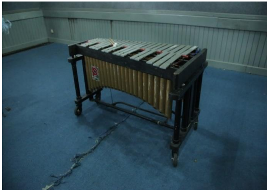
Gambar 5. Instrument Vibraphone. Dokumentasi: Tommy, 2018.

Alat musik tradisional Kacapi (Kecapi) yang berasal dari daerah Sunda Jawa Barat. Kacapi merupakan alat musik yang dimainkan dengan cara dipetik. biasa dimainkan sebagai alat musik utama dalam Tembang Sunda atau Mamaos Cianjuran dan kacapi suling. Di sini pengkarya menggunakan alat musik Kecapi Sunda sebagai salah satu instrumen pendukung dalam karya Saluang Sirompak , dengan hadirnya instrumen alat musik kacapi Sunda ini dapat memperkaya karya ini menjadi karya yang lebih inovatif.