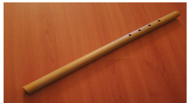
Gambar 1. Empat Giriak Tepat di Punggung Bambu dan 1 di Bawah Lobang Keempat Yang Dihitung dari Bawah.

Bentuk dan organologi dari saluang sirompak ini sendiri sebagai berikut. Saluang memiliki panjang kurang lebih 70 cm dengan ukuran bambu yang kecil, memiliki 4 giriak (lobang nada) yang terdapat di punggung bambu dan 1 girak (lobang nada) di bawah, posisi giriak tambahan ini tepat dibawah lobang ke empat,lobang yang dibawah berfungsi sebagai nada tambahan, tempat meniup saluang yang berada di atas di sebut suai, saluang sirompak sama bentuk suainya dengan saluang darek yang tidak memiliki rit seperti saluang pauah padang atau bansi . Jarak-jarak giriak (lobang nada) saluang sirompak sebagai berikut. Lobang pertama di buat dari bawah bambu dengan ukuran satu lingkaran bambu apa bila lobang nada di buka akan menghasilkan nada mendekati RE (2), giriak (lobang nada) kedua berjarak setengah dari lingkaran bambu yang di ukur dari lobang pertama, dan apa bila lobang nada di buka maka akan menghasilkan nada yang mendekati MI (3), giriak (lobang nada) ketiga berjarak setengah dari lingkaran bambu yang di ukur dari lobang nada kedua,dan apa bila lobang nada di buka maka akan menghasilkan nada mendekati fa (4), giriak (lobang nada) keempat berjarak setengah dari lingkaran bambu yang di ukur dari lobang nada ke tiga,dan apa bila lobang nada di buka maka akan menghasilkan nada mendekati SOL (5),lobang tambahan yang berada di bawah lobang sol agak mengarah LA (6) tapi tidak sampai LA(6) jika di ukur dengan alat ukur nada.