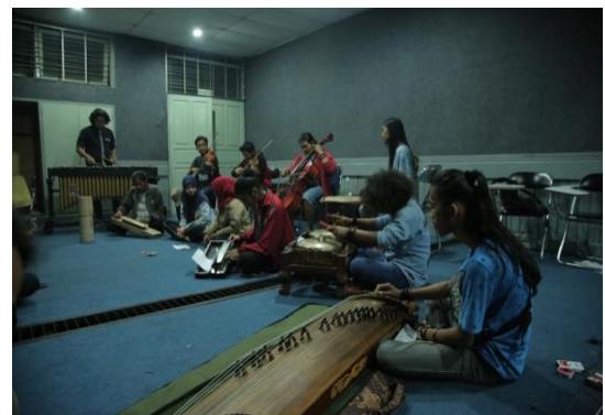
Gambar 3. Proses Latihan.

Gambar ini merupakan salah satu dokumentasi proses latihan karya komposisi musik karawitan yang terinspirasi dari saluang sirompak . Pengkarya mencoba menciptakan suatu karya yang inovatif dengan latar belakang keunikan nada pada saluang sirompak . Dengan ilmu dan teknik garap pengkarya mencoba menghadirkan rasa saluang sirompak dengan wajah baru.