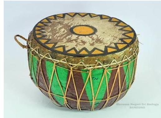
Gambar 6. Instrumen Dol Bengkulu.

sehingga perpaduan instrumen biola dengan Saluang Sirompak dapat menghadirkan kebaharuan dalam berkarya yang tentunya tidak terlepas dari konsep dan nilai-nilai estetis.