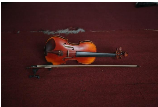
Gambar 6. Instrumen Biola.

Instrumen Vibraphone merupakan jenis alat musik perkusi yang menggunakan batang-batang aluminium sebagai sumber bunyi. Alat musik ini dimainkan dengan cara dipukul sesuai dengan nada yang dimainkan. Bunyi alat musik ini lebih halus. Kehadiran alat musik Vibraphone pada karya ini tidak jauh berbeda fungsinya dengan instrumen musik yang lain, di samping untuk memperkaya khasanah berkarya, alat musik ini juga dimaksudkan untuk menambah nilai-nilai estetis dan kreatifitas dalam berkarya, sehingga lahirnya karya yang inovatif sebagaimana yang dimaksudkan oleh pengkarya.