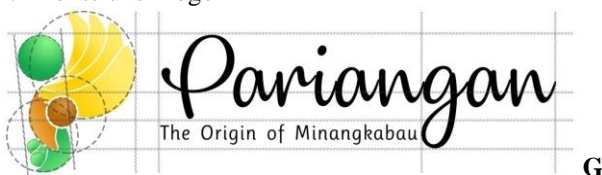
Gambar 6. Konstruksi Logo

Konstruksi logo bertujuan untuk menjaga agar tetap pada proporsi yang benar sesuai ketentuan. Ketentuan ini juga berfungsi untuk tetap menjaga ciri khas logo baik itu ukuran dan jarak antara elemen-elemen yang terdapat