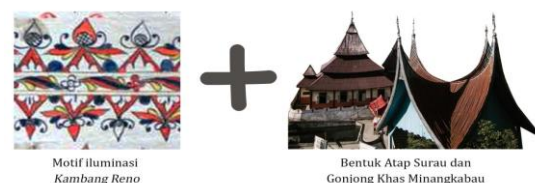
Gambar 2. Sumber Inspirasi Bentuk Visual

Reno yang berarti emas, adalah merupakan warisan budaya dan seluruh potensi di nagari Pariangan yang berharga bagaikan emas. Emas adalah perwakilan dari sesuatu yang sangat berharga baik dulu dan sekarang. Berkilau dan menarik perhatian banyak orang, Reno juga bisa di artikan dengan perhiasan, karena nenek moyang orang Minangkabau sejak dahulu memiliki keterampilan membuat perhiasan baik dari emas ataupun perak.