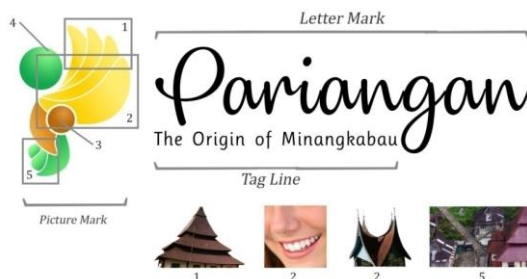
Gambar 5. Pembagian Komponen Logo

Logo Nagari Pariangan terdiri dari picture mark dan letter mark . Dalam picture mark terbagi lagi kedalam beberapa komponen logo yang tidak boleh di pisah dan di ubah. Sedangkan pada letter mark terdapat tag line yang menjadi khas tersendiri bagi logo ini. Dalam pengampikasian logo nagari Pariangan ini bagian picture mark dan letter mark boleh dipisah. Ketentuan ini agar logo lebih fleksibel ketika di aplikasikan pada media yang berukuran kecil.