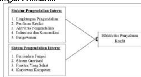
Gambar 1. Kerangka Pemikiran