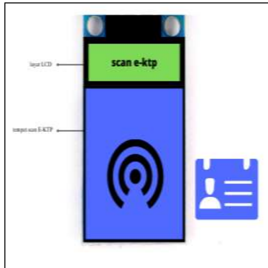
Gambar 2. Desain alat kunci pintu