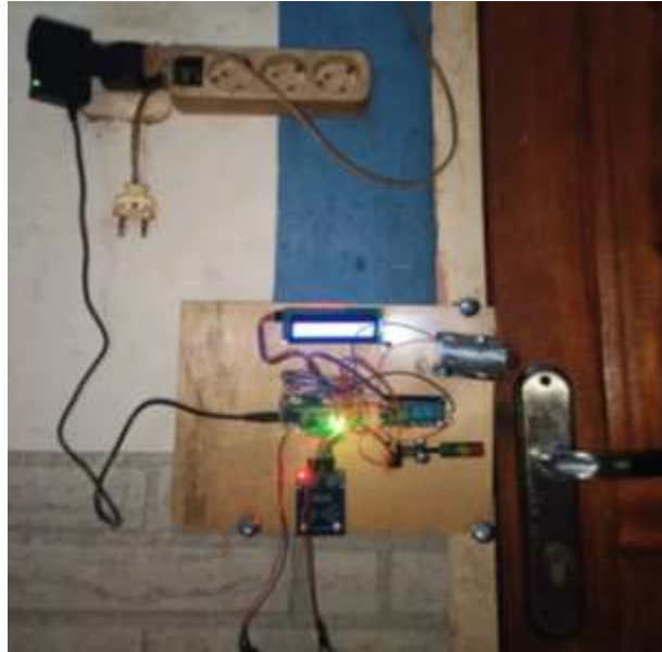
Gambar 5. Hasil Alat Buka Tutup Pintu