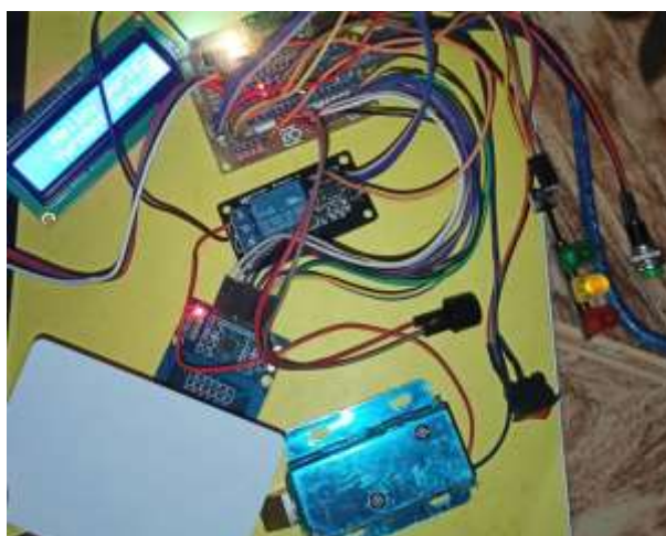
Gambar 4. Konstruksi alat buka tutup pintu

Hasil perancangan elektronika Konstruksi dari alat buka tutup pintu dengan arduino merujuk pada desain yang ada pada bab III, berikut adalah konstruksi elektronika yang digunakan pada gambar dibawah ini: