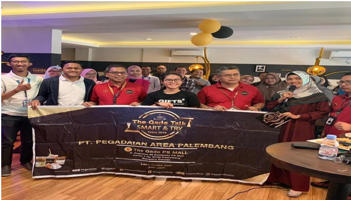
Gambar 2. Suasana Pelatihan