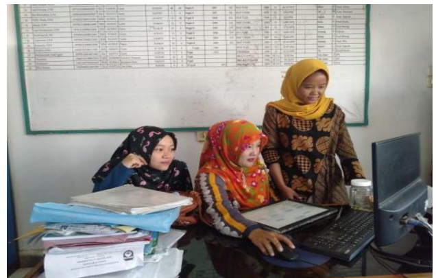
Gambar 5 Sosialisasi Arsip Aplikasi Sistem Pengelolaan Arsip Surat

Agar penggunaan aplikasi tepat sasaran maka dilakukan sosialisasi terhadap warga sekolah khususnya staf tata usaha tentang tata cara penggunaan aplikasi. Agenda sosialisasi menjelaskan tentang penggunaan aplikasi dan cara mengatasi jika terjadi kendala pada saat menggunakan aplikasi.