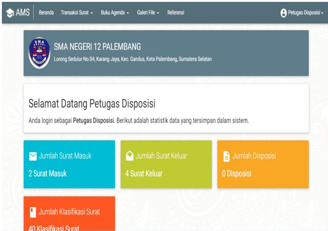
Gambar 2 Halaman Utama Aplikasi Sistem Pengelolaan Arsip Surat

Tampilan ini muncul saat setelah pengguna melakukan login, terdapat informasi jumlah surat masuk, surat keluar, disposisi, klasifikasi surat dan pengguna