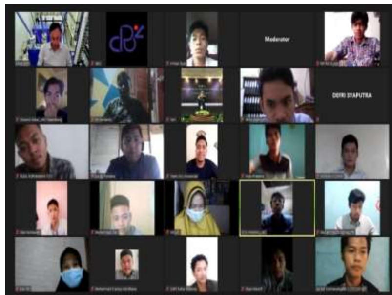
Gambar 3. Pelaksanaan PKM