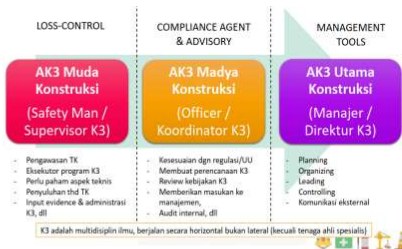
Gambar 5. Tingkatan Dalam Ahli K3 Konstruksi

Terkait regulasi ada berapa tingkatan dalam ahli K3 (AK3) konstruksi yaitu AK3 Muda konstruksi, AK3 Madya Konstruksi dan AK3 Utama Konstruksi, seperti terlihat pada gambar 5.