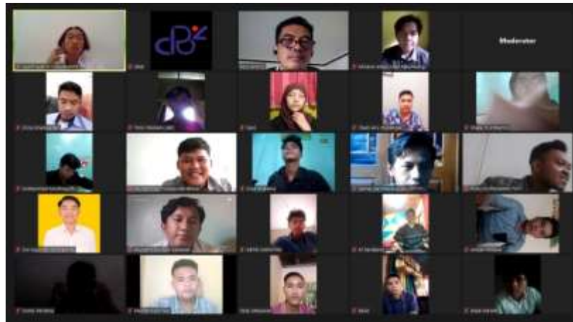
Gambar 4. Pelaksanaan Akhir PKM