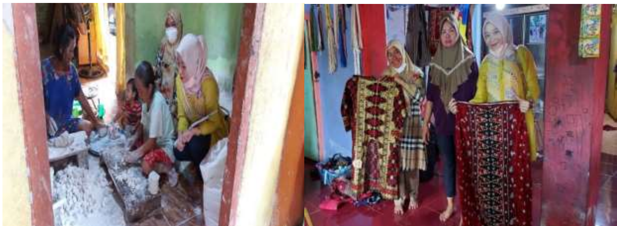
Gambar 3. Kegiatan pada tahap perencanaan: Mendatangi tempat usaha di Desa Kerinjing, Ogan Ilir

Tahap kedua, pelaksanaan kegiatan dilakukan dengan memberikan dan menjelaskan materi yang terkait dengan topik kegiatan. Pemateri akan menjelaskan materi mengenai definisi dari SDM dan perencanaan SDM, pentingnya perencanaan SDM, metode perencanaan SDM, serta komponen dalam perencanaan SDM. Selain memberikan materi, pemateri juga memberikan kesempatan kepada para peserta kegiatan untuk dapat memberikan pertanyaan mengenai hal-hal yang berkaitan dengan topik kegiatan ataupun di luar topik kegiatan. Hal ini dilakukan untuk mempertajam pemahaman mengenai materi yang telah dijelaskan dan mencoba memberikan solusi terhadap permasalahan yang sedang dihadapi oleh para pelaku usaha mikro terkait dengan pengelolaan usahanya.