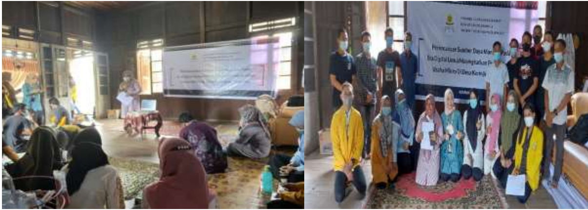
Gambar 4. Kegiatan pada tahap pelaksanaan: Pemberian materi dan foto bersama dengan peserta kegiatan

Tahap ketiga, yaitu evaluasi terhadap hasil kegiatan yang diharapkan. Melalui kegiatan ini diharapkan akan memberikan pemahaman bagi para pelaku usaha mikro dalam hal perencanaan SDM pada era digital.