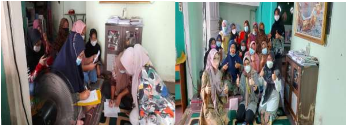
Gambar 5. Kegiatan pada tahap evaluasi: Melakukan evaluasi kegiatan

Tahap ketiga, yaitu evaluasi terhadap hasil kegiatan yang diharapkan. Melalui kegiatan ini diharapkan akan memberikan pemahaman bagi para pelaku usaha mikro dalam hal perencanaan SDM pada era digital.