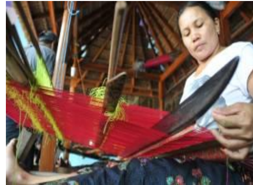
Gambar 4. Suasana Pelatihan