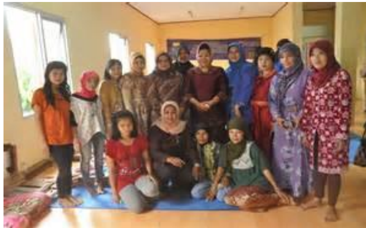
Gambar 2. Para Pekerja Penenun Songket di Kecamatan Tanjung Batu

Peranan perempuan dalam berbagai pekerjaan yang dilakoni dalam rangka mendukung suami guna pemenuhan perekonomian keluarga menuju keluarga yang sejahtera. Hal ini ditegaskan pula oleh Riris W, Widati (2002:22) bahwa Diantara perempuan penenun, selain bekerja sendiri, ada yang menjadi tenaga kerja lepas dari para pengusaha pertenunan (house based worked). Biasanya model ini sangat diminati perempuan yang sudah menikah, karena bisa bekerja sambil melakukan tugas-tugas domestik.