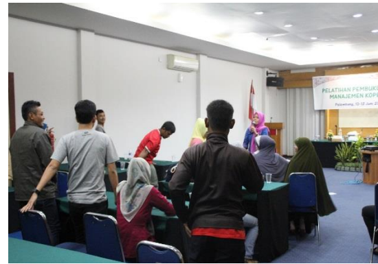
Gambar 3. Suasana Pelatihan