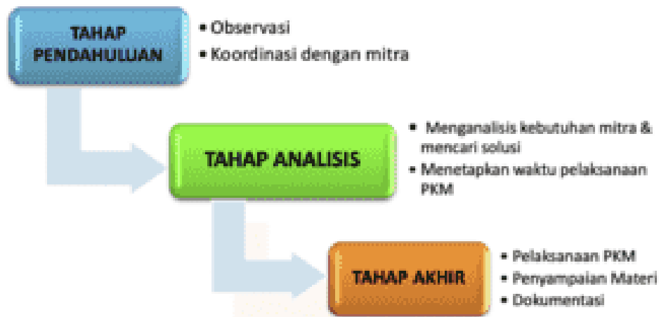
Gambar 1. Tahapan Pelaksanaan PKM

Adapun tahapan yang telah dilakukan dalam pelaksanaan PKM ini dimulai dengan observasi ke beberapa orang mahasiswa untuk mengidentifikasi kebutuhan akan kegiatan peningkatan kemampuan literasi digital pada mahasiswa dalam pengembangan organisasi dan kepemimpinan. Setelah dilakukan observasi, selanjutnya tim PKM melakukan koordinasi dengan mitra PKM yang akan menjadi tempat penyelenggaraan literasi digital pada mahasiswa dalam pengembangan organisasi dan kepemimpinan ini. Koordinasi ini terkait teknis pelaksanaan PKM, kebutuhan perlengkapan PKM, format kegiatan, tahapan kegiatan, kelompok sasaran, dan hasil yang diharapkan (Dirjen, 2023).