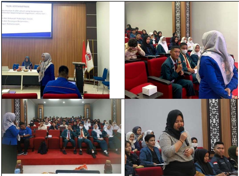
Gambar 2. Suasana Pelaksanaan PKM pada saat Penyampaian Materi dan Diskusi

Materi lainnya yang tak kalah penting disampaikan adalah mengenai literasi digital. Literasi digital adalah tindakan individu dalam menggunakan teknologi dan fasilitas digital untuk berkomunikasi serta mendapatkan pengetahuan baru dari sumber digital big data pada jaringan internet dengan cara mengidentifikasi, mengakses, mengelola, mengintegrasikan, mengevaluasi, menganalisis dan mensintesis sumber daya digital (Nika et al., 2022).