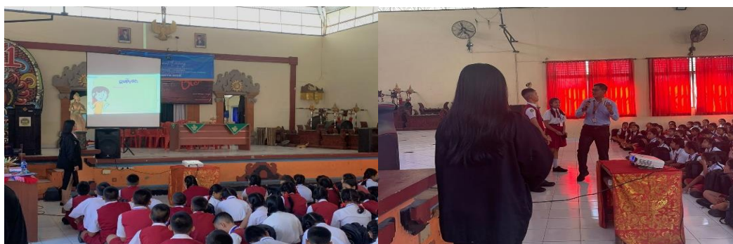
Gambar 2. Dokumentasi pada saat pemaparan materi CBP Rupiah

Kegiatan berikut dilaksanakan di SMP N 1 Tabanan pada pukul 10.00 – 12.00 WITA. Berikut Beberapa Dokumentasi yang saya lampirkan pada artikel ini: