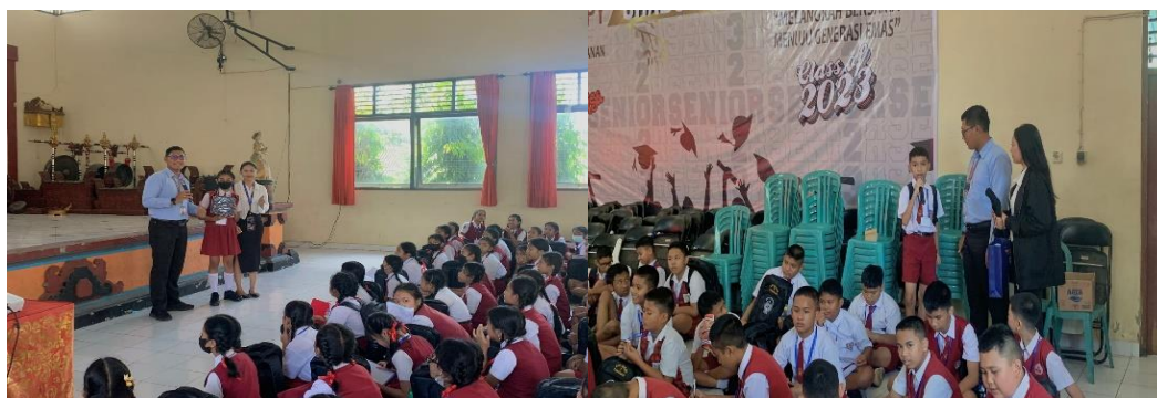
Gambar 3. Foto dokumentasi pada saat pemberian souvenir kepada siswa-siswi teraktif di sesi GAMES berlangsung.