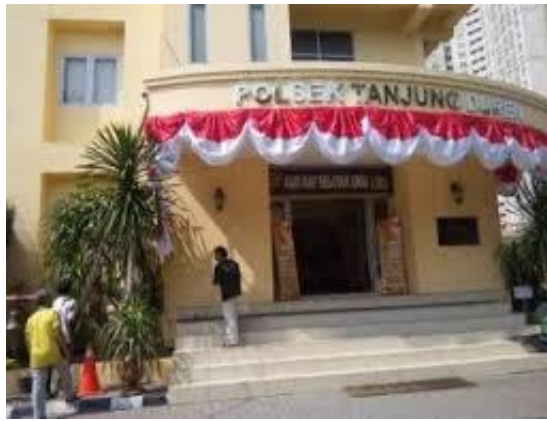
Gambar 4. Tampak muka Polsek Tanjung Duren