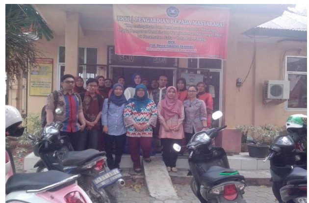
(b) Foto Bersama Setelah Kegiatan