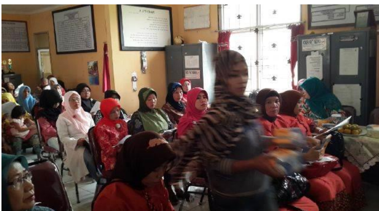
(a) Ibu-ibu PKK Kec. Sako selaku Peserta Kegiatan

Analisis neraca keuangan ditujukan untuk mengetahui posisi keuangan dari organisasi dalam hal ini PKK Kecamatan Sako pada suatu periode tertentu. Neraca merupakan bagian dari laporan keuangan yang dibuat setahun sekali. Neraca memiliki beberapa unsur yang secara garis besar dapat dibagi menjadi tiga meliputi harta, kewajiban dan modal. Melalui analisis neraca ini juga akan bermanfaat bagi peserta sehingga dapat membedakan antaraa harta, kewajiban maupun modal (Hanafi, 2007).