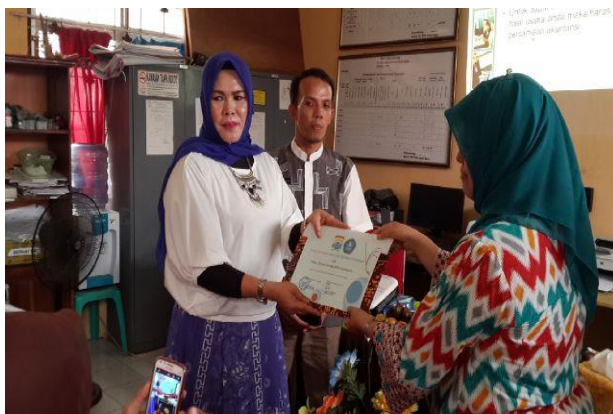
(a) Pemberian Cendera Mata

Setelah dilakukan penyampaian materi dan test pasca penyampaian materi, peserta diarahkan untuk membuat laporan keuangan sederhana, hasilnya sebagian besar peserta telah mampu membuat laporan keuangan sederhana seperti laporan laba rugi, perubahan ekuitas dan arus kas. Namun untuk neraca, diketahui bahwa sebagian peserta cukup mengalami kesulitan, hal ini mayoritas disebabkan oleh kurangnya ketelitian peserta sehingga umumnya laporan neraca yang dibuat tidak seimbang ( unbalanced ). Namun secara umum dapat disimpulkan bahwa Peserta telah mampu baik untuk membuat laporan keuangan sederhana baik secara personal maupun secara berkelompok.