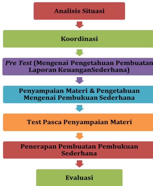
Gambar 4. Tahapan Kegiatan Pengabdian