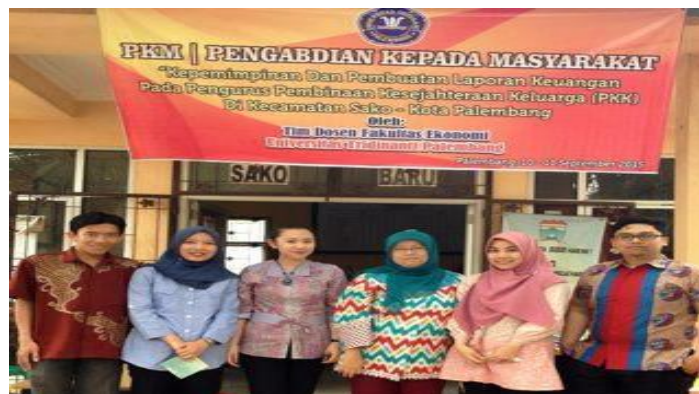
Gambar 1. Tim Dosen Pengabdian Kepada Masyarakat UTP di Depan Kantor Camat Sako

Pengabdian Kepada Masyarakat merupakan suatu media untuk menjembatani dunia pendidikan dengan masyarakat, dimana Perguruan Tinggi dihadapkan pada masalah bagaimana agar warga masyarakat mampu menghadapi tantangan lebih jauh ke depan di era globalisasi. Berdasarkan hasil statistik di Tahun 2015 ditemukan bahwa masih banyak keluarga yang masuk dalam kategori belum sejahtera di Kecamatan Sako Palembang (BPS, 2015), salah satu upaya untuk meningkatkan kesejahteraan masyarakat di Kecamatan Sako Palembang, dibentuklah suatu badan / organisasi untuk melakukan pembinaan dan kesejahteraan keluarga dilingkungan Kecamatan Sako Palembang. Organisasi tersebut adalah Ibu-ibu Pembinaan Kesejahteraan Keluarga (PKK) Kecamatan Sako.