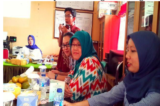
(a) Peserta Mendengarkan pemaparan materi