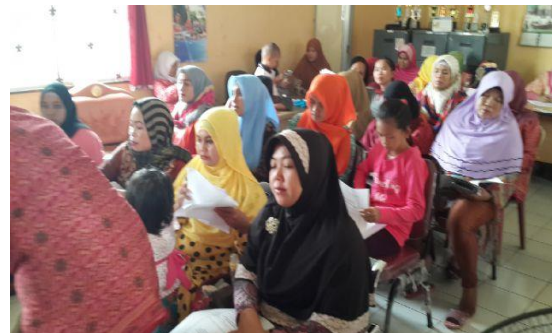
(a) Peserta Mengerjakan Pre Test