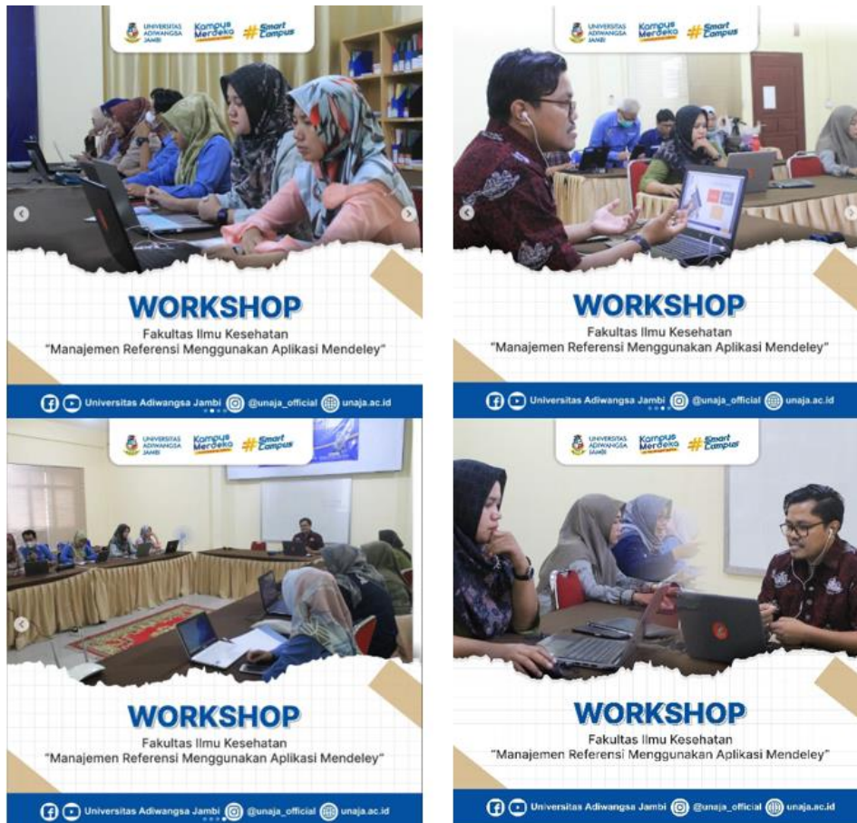
Gambar 1. Kegiatan Pelatihan secara luring