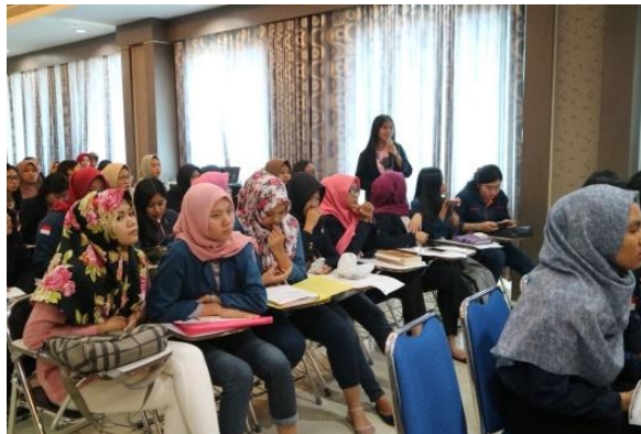
Gambar 2. Keadaan saat kegiatan

Persiapan yang dilakukan dalam rangka kegiatan pengabdian tersebut yaitu menyediakan ruangan aula untuk kegiatan yang memiliki kapasitas 250 orang peserta beserta dengan kelengkapan lainnya yang diperlukan seperti Sound System, Infocus, Printer, Meja Registrasi, Daftar hadir dll. Bahan materi telah disiapkan oleh instruktur sebagai pegangan bagi peserta selama pelaksanaan kegiatan berlangsung. Berikut gambar keadaan saat kegiatan.