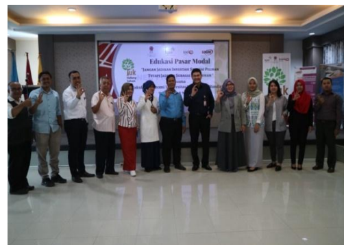
Gambar 3. Sesi Tanya Jawab