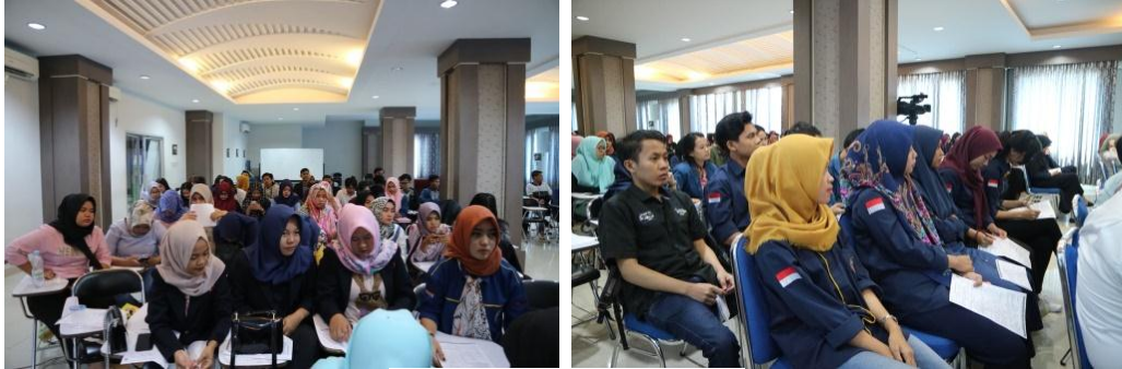
Gambar 5. Suasana Acara

Hasil dari kegiatan ini yaitu para dosen dan mahasiswa memperoleh pemahaman yang lebih mendalam mengenai pasar modal, berinvestasi di bursa efek dan pemahaman tentang menabung saham. Selain ilmu yang didapat, hasil dari pengabdian ini adalah dosen dan mahasiswa divasilitasi oleh bursa efek dengan menyediakan satu perusahaan sekuritas yang menyediakan pembuatan akun yang dapat digunakan untuk berinvestasi termasuk investasi menabung saham. Dimana pembuat akun tersebut hanya menyetorkan uang Rp 100,000,- yang dijadikan saldo awal investasi. Berikut ini gambar peserta saat mengikuti acara yang sedang berlangsung.