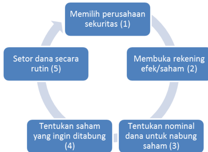
Gambar 4. Siklus Menabung Saham

Kegiatan selanjutnya Bursa Efek Indonesia Perwakilan Sumatera Selatan memberikan materi kedua terkait investasi yang berisi pengertian dari investasi, produk investasi di Bursa Efek Indonesia, tips melihat investasi bodong. Hal yang menarik di materi kedua ini adalah dosen dan mahasiswa dijelaskan secara detail terkait salah satu produk investasi di Bursa Efek Indonesia yaitu saham. Bursa Efek Indonesia menjelaskan secara jelas pengertian dari saham, tips melihat saham yang baik, bagaimana cara menjual dan membeli saham, prosedur dan proses investasi saham, serta memperkenalkan program baru Bursa Efek Indonesia “Yuk Nabung Saham”. Dengan “Yuk Nabung Saham, dosen dan mahasiswa diberikan beberapa langkah yang harus dilakukan yang tergambar pada bagan berikut ini: