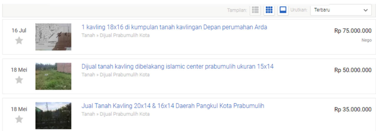
Gambar 2. Contoh Katalog Penjualan Aplikasi Tanah Kavlingan

Adapun contoh katalog dari aplikasi penjualan tanah kavlingan yang kami gunakan didalam pelatihan adalah sebagai berikut: