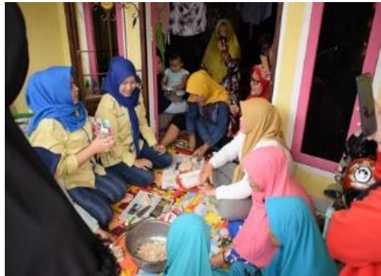
Gambar 2. Pelatihan Skills Pembuatan Kue Tempe Matcha kepada Tim Mitra