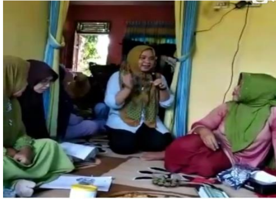
Gambar 1. Sosialisasi yang dilakukan Tim Pengusul kepada Tim Mitra