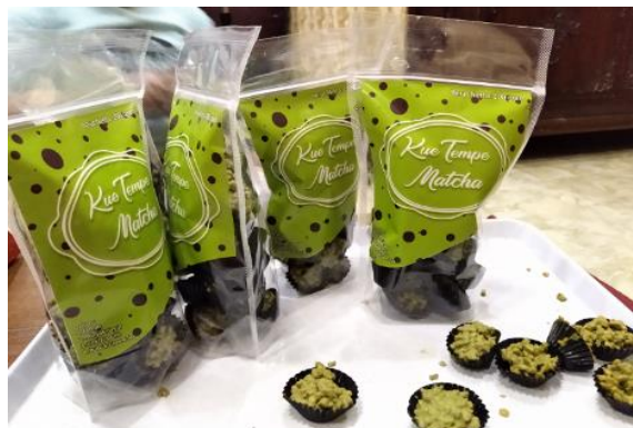
Gambar 3. Kue Tempe Matcha, hasil produksi tim Mitra